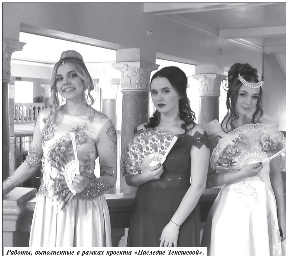
Работы, выполненные в рамках проекта «Наследие Тенешевой».