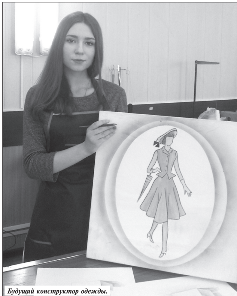
Будущий конструктор одежды.

Закройщик – специалист по созданию моделей одежды, изготовлению лекал и выкроек. Основная деятельность закройщика связана с осуществлением всех операций, предваряющих пошив изделия. Это консультирование клиентов по вопросам стилей и направлений моды, снятие мерок, составление эскиза модели, изготовление выкройки, подбор ткани, раскрой ткани. Закройщик должен знать основные направления моды; методы моделирования швейных изделий; назначение и технические характеристики технологического оборудования; приемы раскроя одежды; способы построения чертежей и лекал; технологические методы и приемы выполнения операций по пошиву одежды из различных материалов. Закройщик должен уметь снимать мерки с клиента; разрабатывать конструкторскую документацию для изготовления изделий различного ассортимента, в том числе с использованием систем